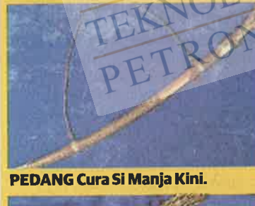
PEDANG Cura Si Manja Kini.