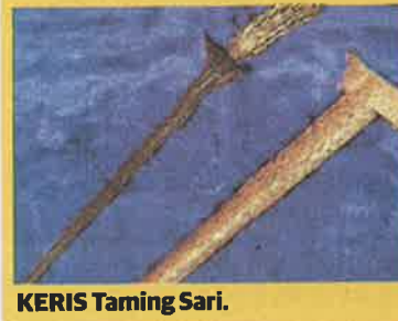
KERIS Taming Sari.

Krishna Pendita mengembara dan akhirnya menjadi raja di Tanjung Pura. Sang Sapurba atau Nila Pahlawan pula dilantik sebagai raja bertakhta di tanah Minangkabau. Daripada jurai keturunan tiga orang putera Raja Suran inilah bermulanya institusi "Kerajaan Beraja" di salah satu wilayah di alam Melayu.