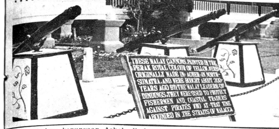
Meriam kepunyaan Aceh di depan Rumah Rehat Lumut.