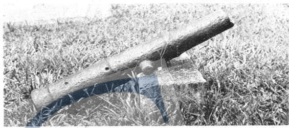
Meriam yang telah patah yang tidak diketahui siapa empunya.