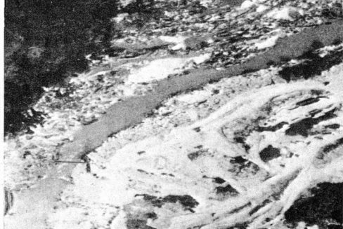
Pemandangan Empangan Temenggor di utara Perak sedang dalam proses pembinaan.