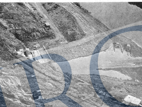
Pemandangan dari udara kawasan Empangan Temenggor.