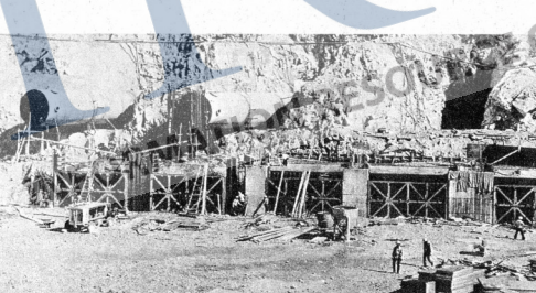
Empat buah janakuasa sedang di pasang untuk mengeluarkan tenaga letrik.

usaha pasukan keselamatan memerangi dan menghancurkan penganas komunis.