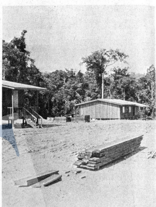
Bentuk rumah baru yang disediakan untuk penduduk Kampung Temenggor di Air Ganda.

Jika dibanding dengan keadaan kediaman mereka di Kampung Temenggor itu dengan apa yang mereka nikmati sekarang, ini merupakan satu perubahan sosio-ekonomi yang pesat yang patut dibanggakan oleh penduduk-penduduk Kampung Ganda Temenggor.