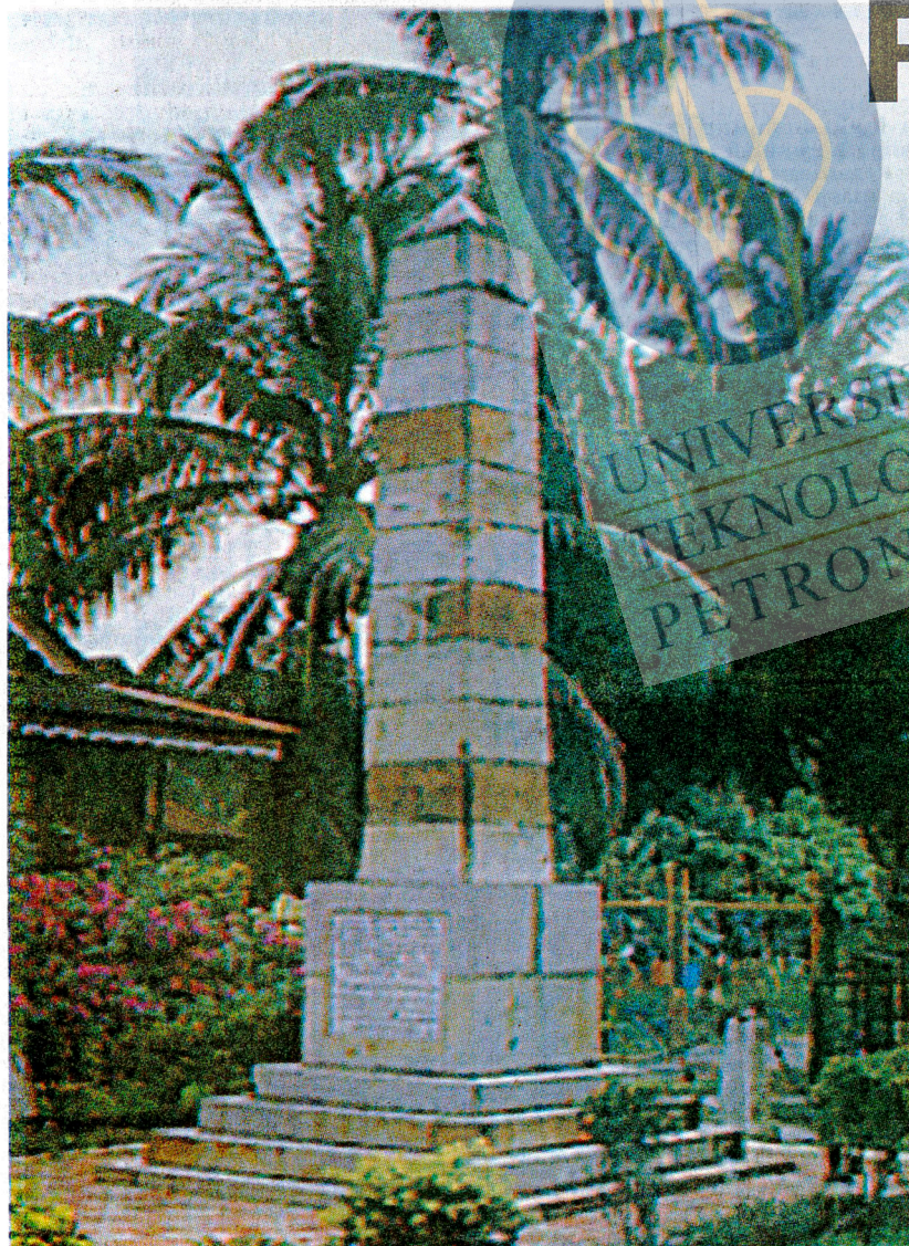
MASIH TEGUH... tugu peringatan JWW Birch.

Dewan pameran berhampiran pusat cenderahati pula mengumpul pelbagai artifak yang ditemui ketika operasi cari gali di padang Sekolah Kebangsaan Tok Pelita, Pasir Salak, tidak lama dulu. Kebanyakan artifak itu ialah pinggan mangkuk China, Belanda dan Belgium, selain tembikar tempatan. Penduduk dari Lembah Klang yang ingin berkunjung ke kompleks itu boleh menggunakan Lebu Raya Utara-Selatan dan melalui Tapah atau Bidor. Orang ramai juga boleh menyusuri Sungai Perak dari Kuala Kangsar untuk ke kompleks itu dengan menggunakan bot atau jet ski.