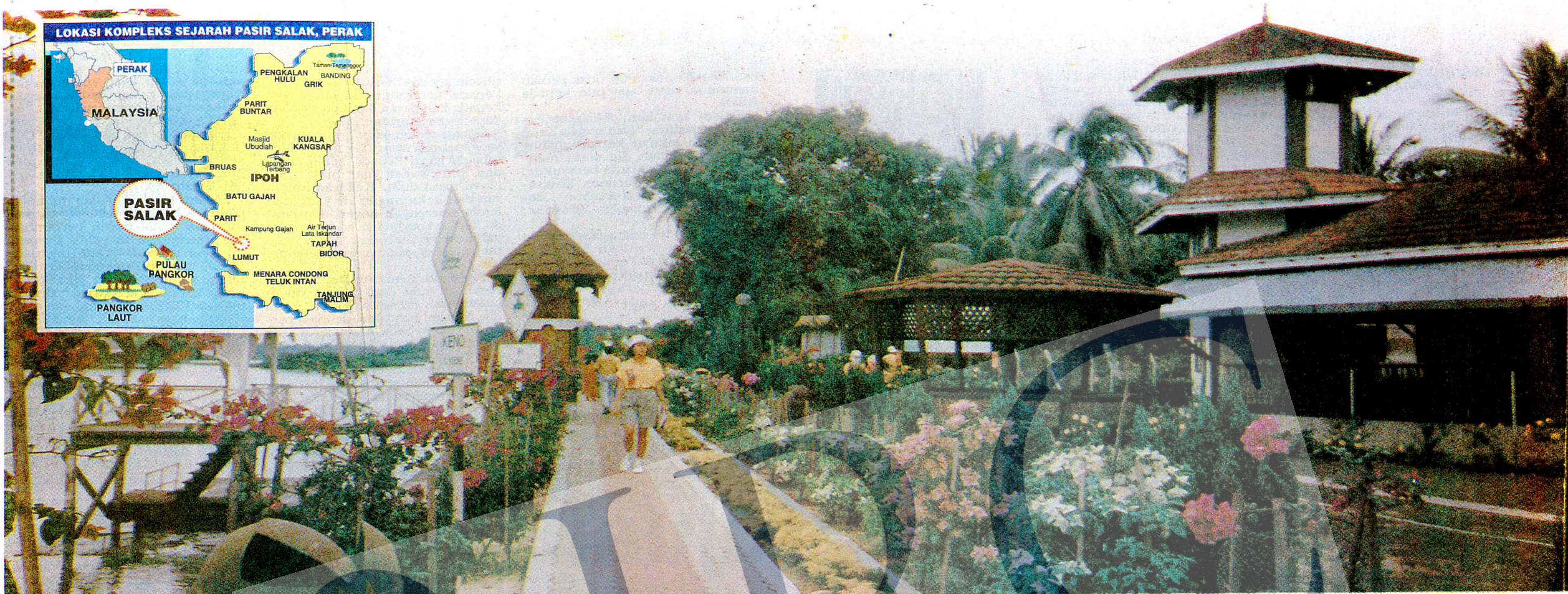
KEISTIMEWAAN... Pasir Salak banyak tempat menarik dan kaya sejarah.