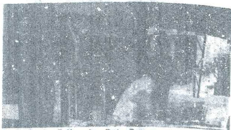
Baginda Sultan dan Raja Perempuan sedang memraktikkan sa-orang pelukis sedang melukis pemandangan di-Istana-nya.