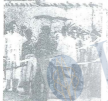
BAGINDA Sultan sedang memotong peta meramalkan sa-batang jalan raya yang di-bina di-bawah rancangan pembangunan luar bandar di-Ulu Perak dalam lawatan baginda ke-kawasan itu.

Adak berantak baginda terdiri dari 11 orang saudara lelaki dan perempuan, tetapi hanya tujuh orang saja yang masih hi-duk (tiga lelaki dan empat perempuan) terkemak baginda sendiri. Sa-laku dari itu, ada lagi empat orang saudara, tiga baginda, dua orang berantak diri baginda, sa-orang masih hidup, sa-orang daripada-nya sa-lah Raja Fatimah, Tengku Sa-mudut Pabang.