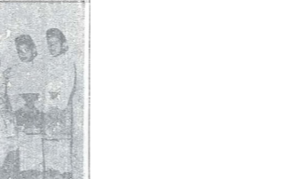
Baginda Sultan dan Raja Perempuan Perak berantak dengan ananda-nya. Ananda berantak yang berantak sa-orang dari istana orang yang me-wawahi takhta kerajaan negeri Perak.