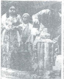
SULTAN Perak sedang menuchorkan ayer di-kuhor sa-orang dari kaum keluarga baginda. Di-sabalah baginda yang memantut kacha mala, hikan itu sa-lah Raja Perempuan Perak.