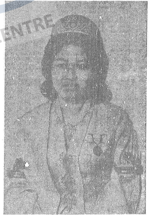
Duli Yang Maha Mulia Paduka Sri Sultan Idris Al Mutawakkil Alai- lah Shah ibni Almarhum Sultan Iskandar Shah, D.M.N., D.K., S.P.M.P., C.M.G., P.J.K., Sultan negeri Perak.