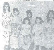
Baginda Sultan dan Raja Perempuan Perak berantak dengan ananda-nya. Ananda berantak yang berantak sa-orang dari istana orang yang me-wawahi takhta kerajaan negeri Perak.